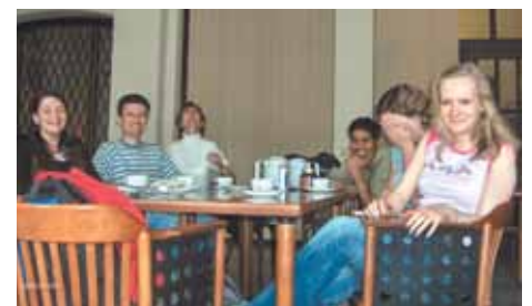
Neue Freunde finden bei der International Coffee Hour...

Am 23. Oktober fand zum ersten Mal die International Coffee Hour (ICH) gemeinsam mit dem Kulturbüro des Akademischen Auslandsamts (AAA) der TU Dresden statt. Es wurde gekocht und gegessen und anschließend kamen alle überein, dass diese Veranstaltungsreihe fortgeführt werden müsse. Der Erfolg der Aktion gab den Veranstaltern recht – die nächste gemeinsame Veranstaltung mit dem Kulturbüro findet am 27. November statt. Interessenten sind herzlich eingeladen, zu kochen. Einfach beim nächsten Treffen vorbeikommen und die Tutoren ansprechen. Natürlich hat die