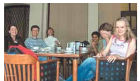
Neue Freunde finden bei der International Coffee Hour...

Am 23. Oktober fand zum ersten Mal die International Coffee Hour (ICH) gemeinsam mit dem Kulturbüro des Akademischen Auslandsamts (AAA) der TU Dresden statt. Es wurde gekocht und gegessen und anschließend kamen alle überein, dass diese Veranstaltungsreihe fortgeführt werden müsse. Der Erfolg der Aktion gab den Veranstaltern recht – die nächste gemeinsame Veranstaltung mit dem Kulturbüro findet am 27. November statt. Interessenten sind herzlich eingeladen, zu kochen. Einfach beim nächsten Treffen vorbeikommen und die Tutoren ansprechen. Natürlich hat die