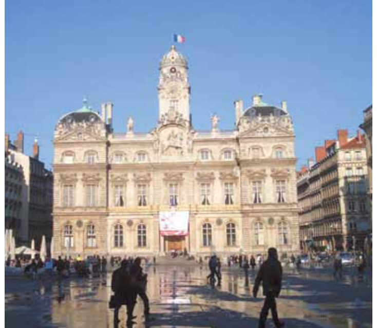
Lyon – immer eine Reise wert ...