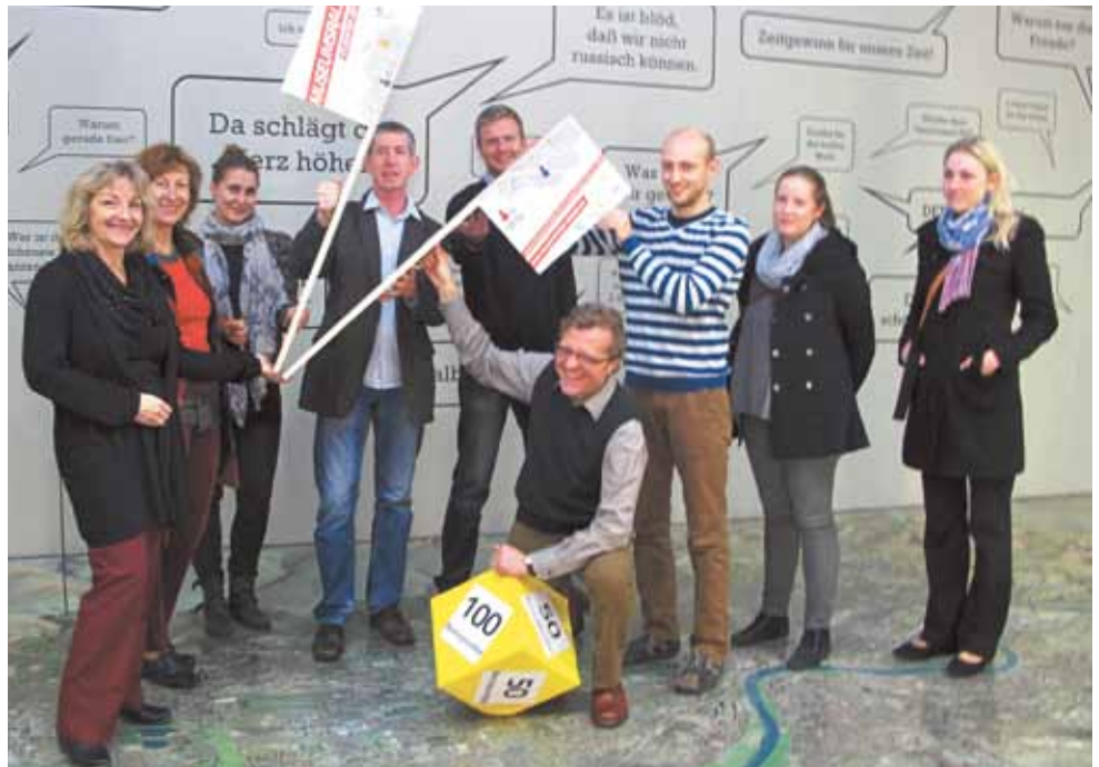
Startete mit viel Engagement: Die erste Dresdner Museumsrallye

Ob Technische Sammlungen, oder Städtische